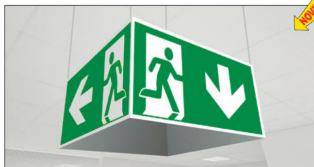
CQ20/A 480x250x480 mm CQ20/B 960x500x960 mm