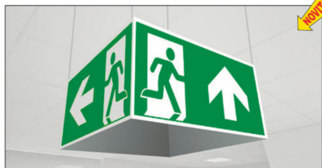
CQ10/A 480x250x480 mm CQ10/B 960x500x960 mm

Cubo multisimbolo a sospensione per uscite di emergenza costituito da 4 segnali: freccia rivolta verso l'alto, destra, sinistra (cod. CQ10 ) e freccia rivolta verso il basso, destra, sinistra (cod. CQ20 ). Il quarto lato resta vuoto. Pittogrammi conformi alla norma UNI EN ISO 7010. Materiale alluminio spessore 10/10 preverniciato bianco, catenella e minuteria comprese. Il prodotto dovrà essere assemblato poiché fornito smontato.